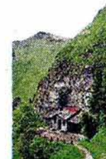
Concerto all'alba al rifugio dei Loff